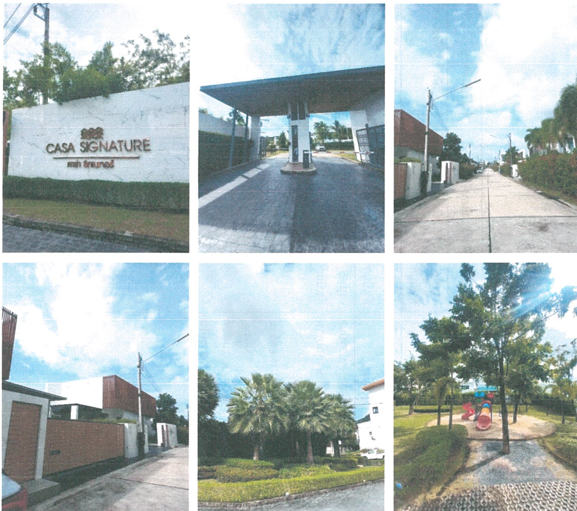
รูปภาพที่ 1.3 การใช้พื้นที่โครงการ